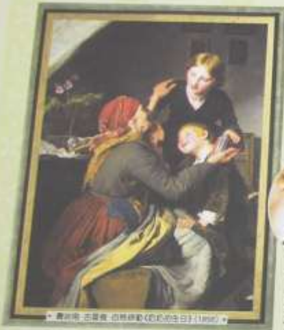
• 荷蘭 約翰內斯·維梅爾《戴紅帽的男孩》(1661) •